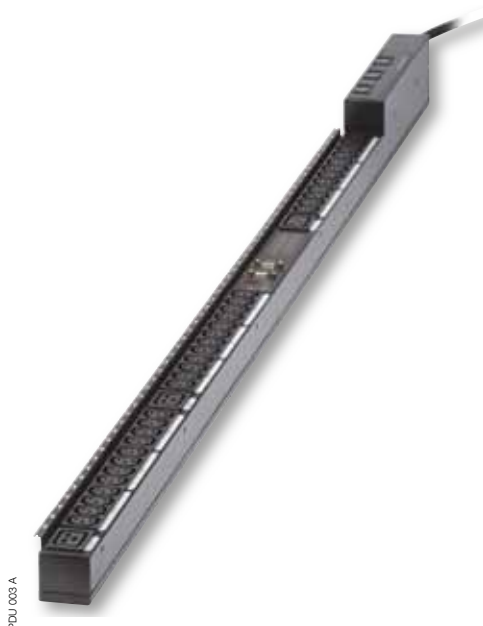
PDU 003 A

Compacte en betrouwbare powerdistributie bewaakte en beheerde rack PDU